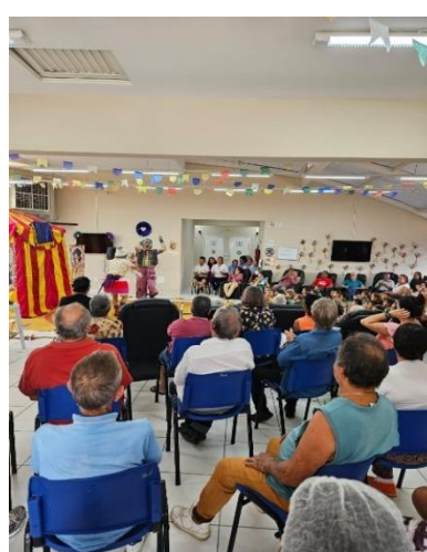
FOTO 3- APRESENTAÇÃO DO CIRCO