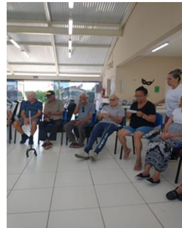
FOTO 3- TERAPIA DE REMINISCENCIA