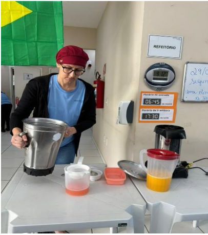
FOTO 1- EDUCAÇÃO NUTRICIONAL