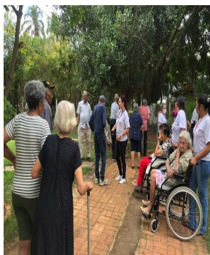
FOTO 2- ALMOÇO DIA DAS MÃES RANCHO DA LINGUIÇA