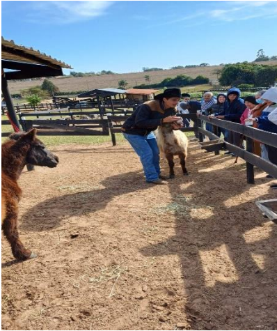
FOTO 1- PASSEIO CREATÓRIO PESTANA