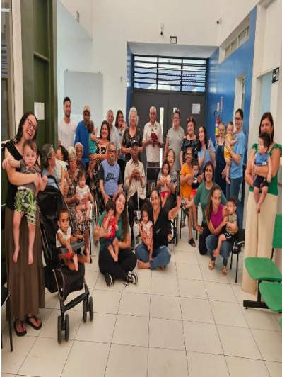
Foto 1- Atividade Intergeracional