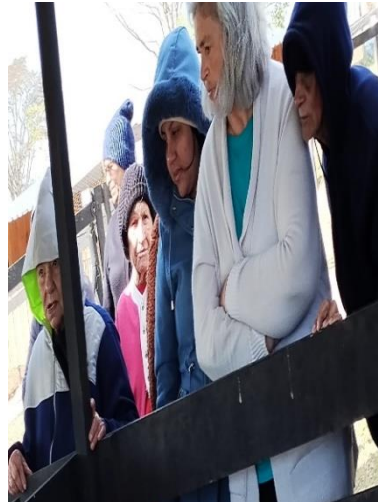
FOTO 2- PASSEIO CRIATÓRIO PESTANA