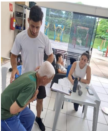
FOTO 1- AVALIAÇÃO FÍSICA E SARC-F