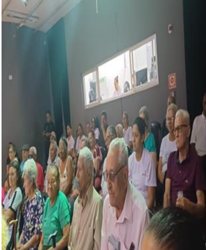
Foto 1- Passeio CÉU das Artes Curta Minha Avó Contou