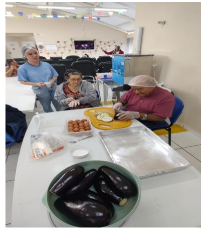
FOTO 3- RESGATE DE OCUPAÇÃO SIGNIFICATIVAS