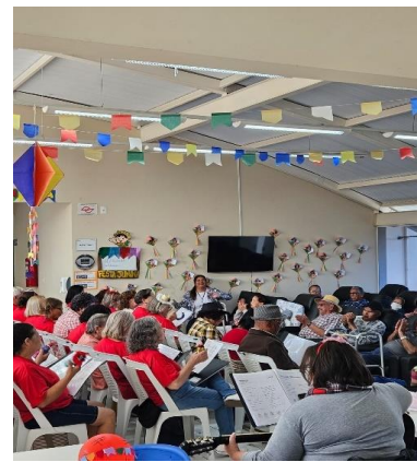
FOTO -3- CORAL DA MAIOR IDADE FESTA JUNINA