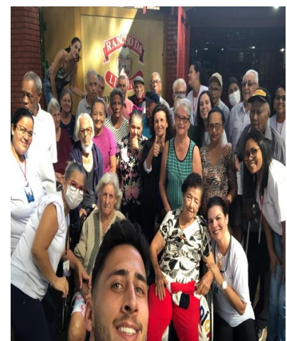
FOTO-3- ALMOÇO DIA DAS MÃES RANCHO DA LINGUIÇA