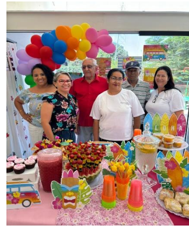
FOTO 3- CARDÁPIO TEMÁTICO