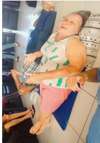
FOTO 2- RELAXAMENTO