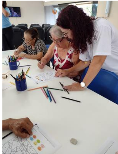
FOTO 2- ESTIMULO COGNITIVO ATRAVÉS DE DESENHO