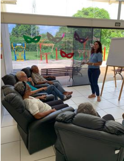
FOTO 1- ESTIMULAÇÃO COGNITIVA PERGUNTAS E RESPOSTAS