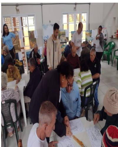
FOTO 2- NARRATIVAS EM TINTA NO VIDA LONGA