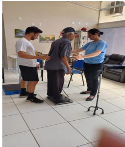
Foto 2- Avaliação Física e Sarc-F