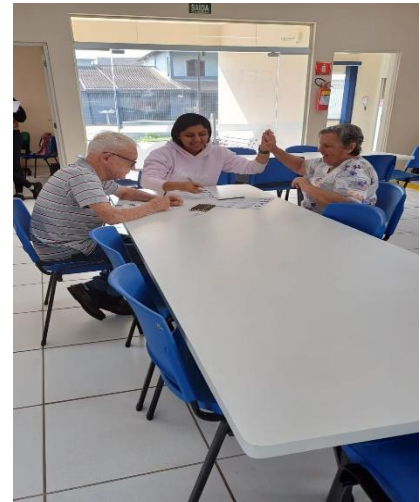
FOTO 3- ATIVIDADE COGNITIVA