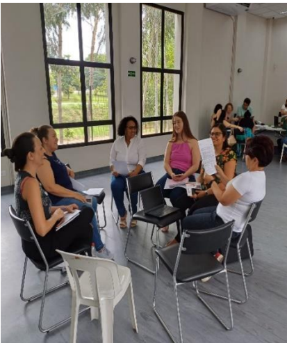
FOTO 1- REUNIÃO DA VIGILÂNCIA SÓCIO ASSISTENCIAL