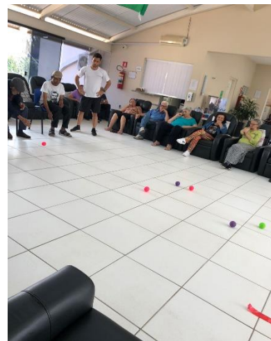
FOTO3- ATIVIDADE LÚDICA VIVENCIANDO ESPORTE BOCHA