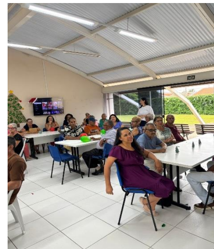
Foto 3- Confraternização com Familiares, Idosos e Equipe CDI