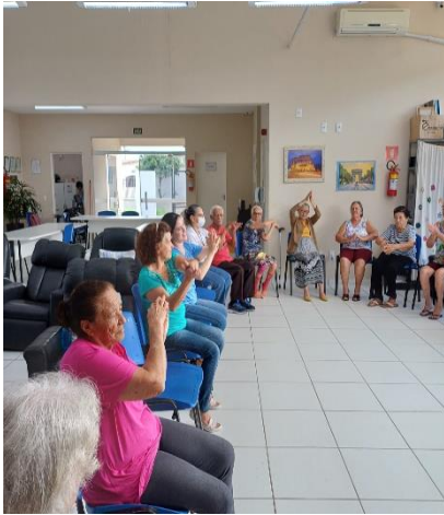
FOTO 1- DANÇA SENIOR