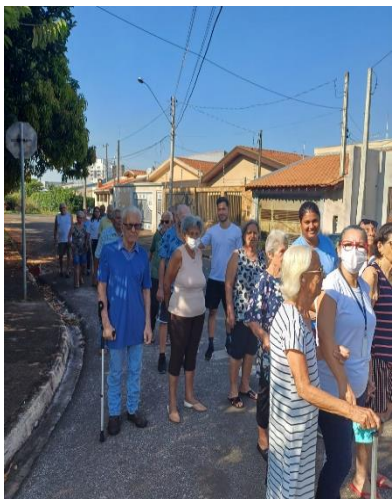
FOTO 1- CAMINHADA