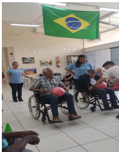
FOTO 2- PARALIMPÍADAS