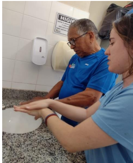
Foto 2- Treino de Atividade da Vida Diária