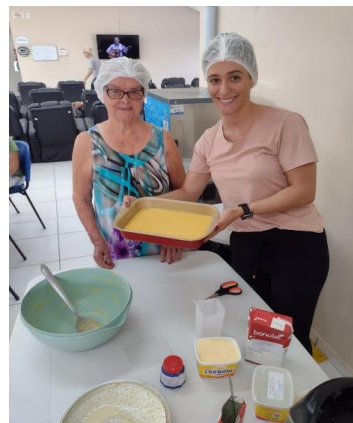
FOTO 2- AULA NUTRICIONAL