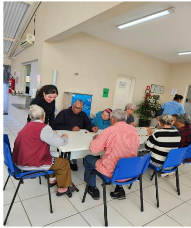
FOTO 2- ATIVIDADE RECURSO TERAPÊUTICO MASSINHA