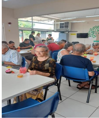
FOTO 2 - FESTA DOS ANIVERSARIANTES VISITA DA PROMOTORA