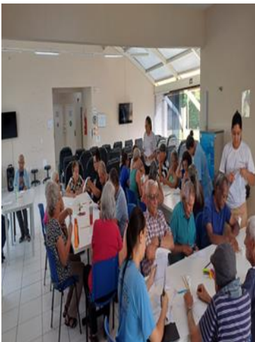
Foto 1- Estímulo Cognitivo