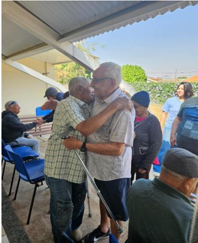
FOTO 1- DIA DO AMIGO