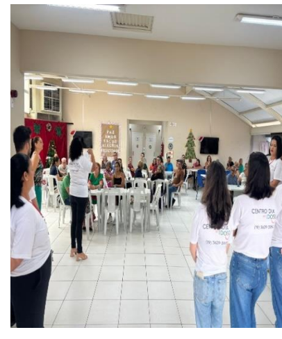
Foto 3- Confraternização com Familiares, Idosos e Equipe CDI