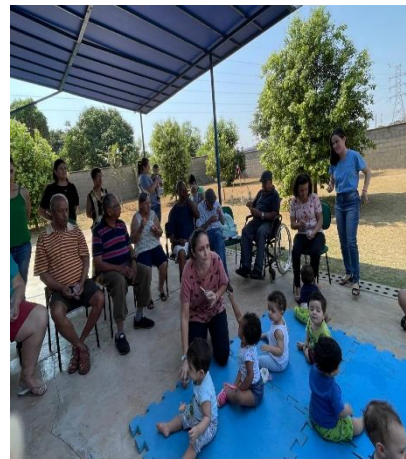
FOTO 3- ENCONTRO INTERGERACIONAL