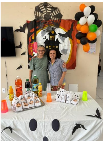
Foto 1- Aniversário Temático