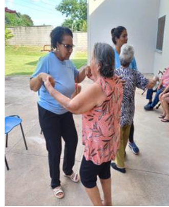
FOTO2- DIVERSÃO E DANÇA