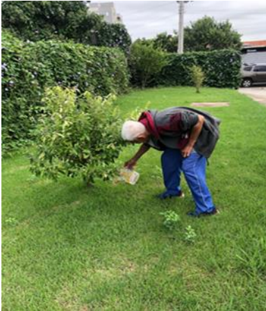
FOTO 1- REGANDO AS PLANTAS