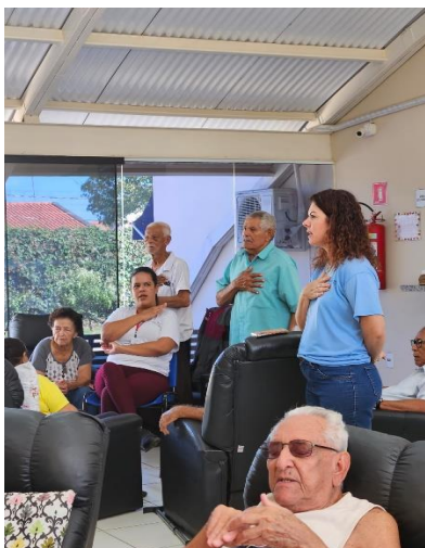
FOTO 1- DESCOBRIMENTO DO BRASIL