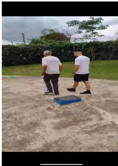
Foto 2- Percurso com Obstáculos