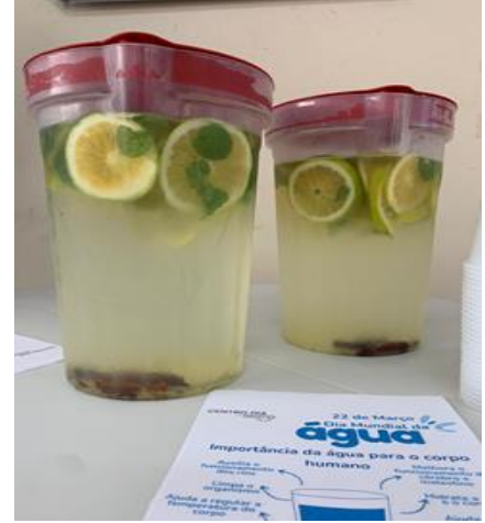
FOTO 1- VOLUNTARIADO CULINÁRIA JAPONESA FOTO 2- FESTEJANDO O CARNAVAL FOTO 3- DIA DA ÁGUA