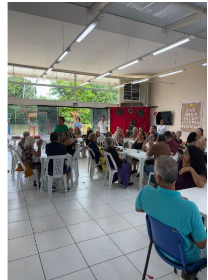
Confraternização com Familiares, Idosos e Equipe CDI