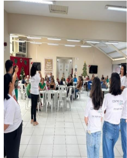
Foto 3- Confraternização com Familiares, idosos e Equipe CDI