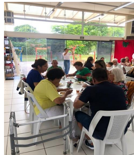
Foto 3- Confraternização com Familiares, Idosos e Equipe CDI