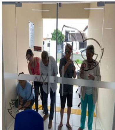
FOTO 2- DECORANDO CARNAVAL