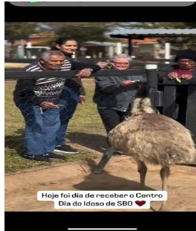
FOTO 2- PASSEIO CREATÓRIO PESTANA