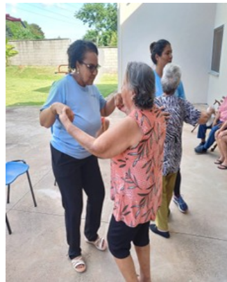
FOTO2- DIVERSÃO E DANÇA