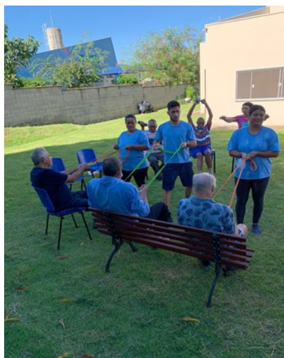
FOTO 2- EXERCÍCIOS DE FORÇA