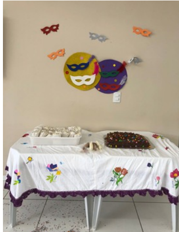
FOTO 2- FESTEJANDO O CARNAVAL