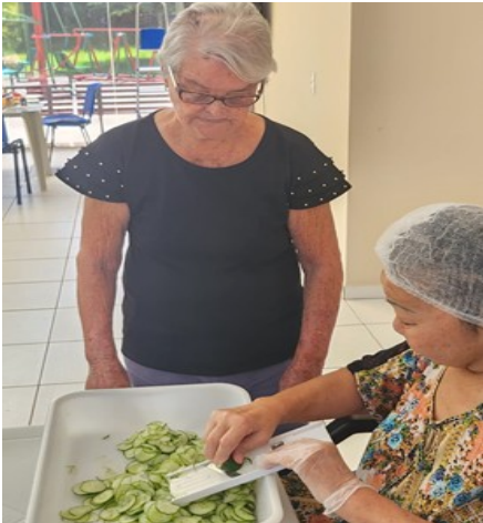
FOTO 1- VOLUNTARIADO CULINÁRIA JAPONESA