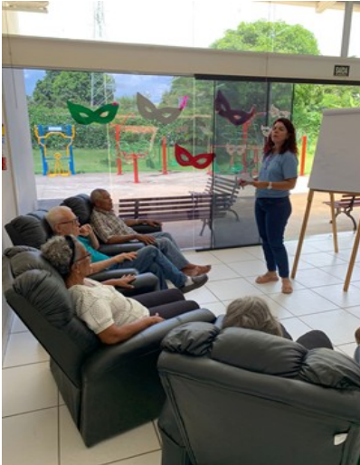
FOTO 1- ESTIMULAÇÃO COGNITIVA PERGUNTAS E RESPOSTAS