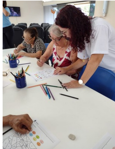
FOTO 2- ESTIMULO COGNITIVO ATRAVÉS DE DESENHO