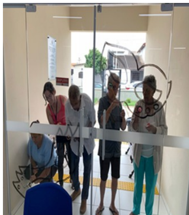
FOTO 2- DECORANDO CARNAVAL