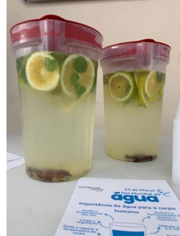
FOTO 3- DIA DA ÁGUA