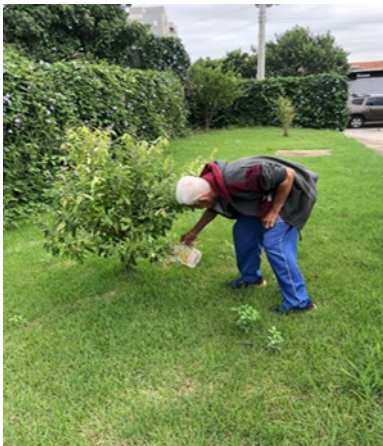
FOTO 1- REGANDO AS PLANTAS