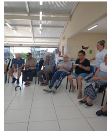
FOTO 3- TERAPIA DE REMINISCENCIA