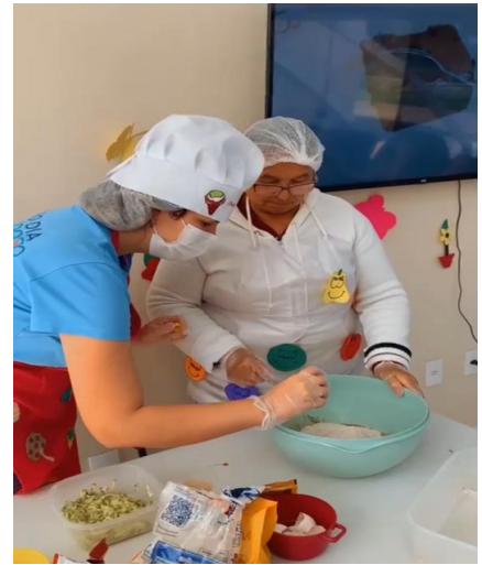
FOTO 3- AULA NUTRICIONAL