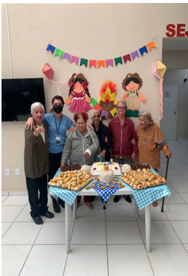
FOTO 1-ANIVERSÁRIO DO MÊS