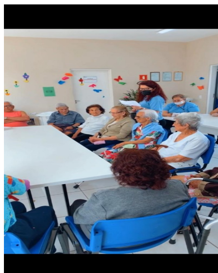
FOTO 2- DINAMICA