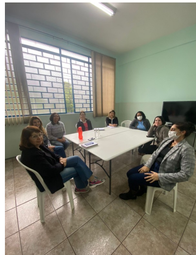
FOTO1- ENCONTRO INTERGERACIONAL FOTO2-VISTA DAS TÉCNICAS DO CPC FOTO 2-VISTA DAS TÉCNICAS DO CDI NO CPC