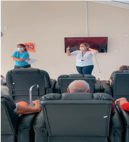
FOTO 1- PALESTRA MULTIDISCIPLINAR