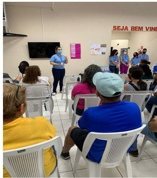
FOTO 2 REUNIÃO FAMILIAR