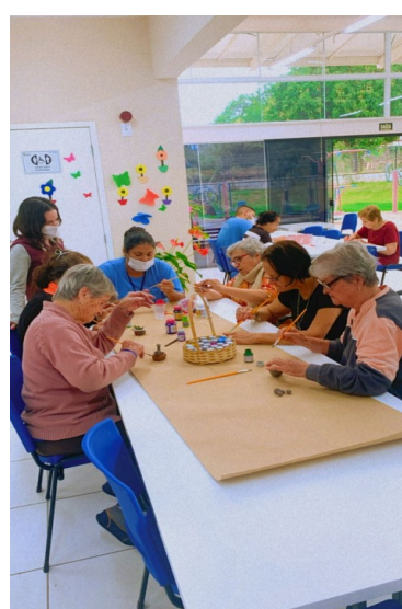
FOTO 1- ATIVIDADE SENSORIAL FOTO 2- RODA DE CONVERSA FOTO 3- ESTIMULAÇÃO COGNITIVA