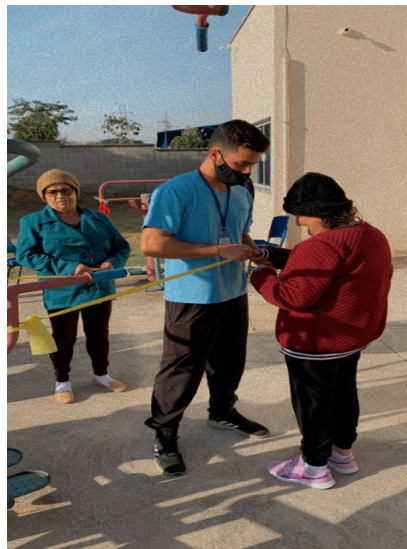
FOTO 2- EXERCÍCIOS DE FORÇA