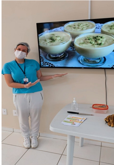
FOTO 1- AULA NUTRICIONAL

Associação Barbarense das Damas de Caridade "Asilo São Vicente de Paulo" Rua General Osório, 266 – Santa Barbara D' Oeste – SP CNPJ: 56.729.205/0001-67 – Telefone: 19 34633058 NUTRICIONISTA