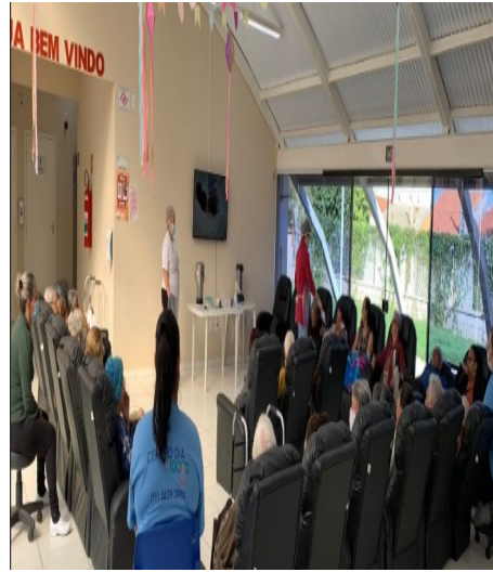
FOTO 2- AULA NUTRICIONAL