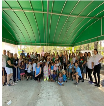
Foto-3 Passeio Intergeracional no CESB