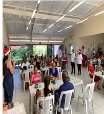
FOTO3- Confraternização Familiar