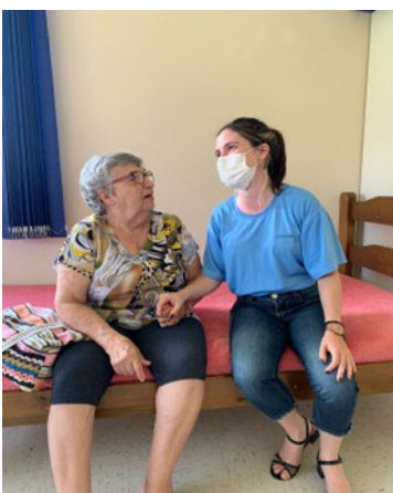
1-Atividade de Auto Cuidado