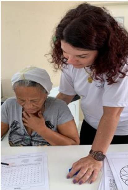
Foto 1- Atividade caça Palavras