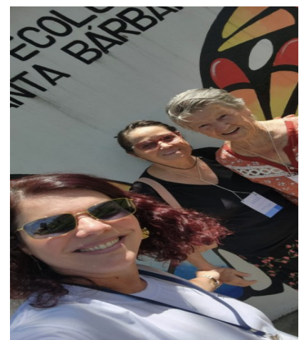
FOTO 3- Passeio no CESB