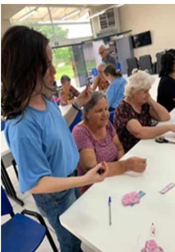
Foto 1- Confeção de Bonecos De Pano