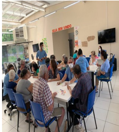
Foto 2 Bingo