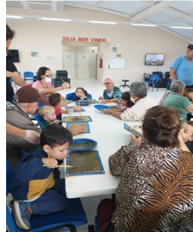
Foto 3- ENCONTRO INTERGERACIONAL