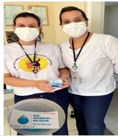
Foto 3- Palestra dia da água