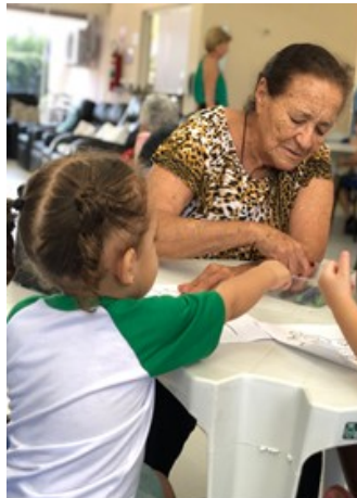
FOTO2- Encontro Intergeracional