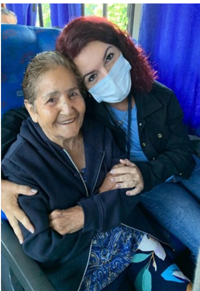
FOTO 1- PASSEIO NO JACARANDAS