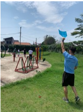
Foto 1- Dia de Pipa