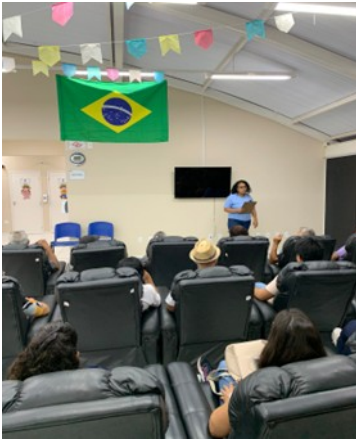
FOTO1- Reunião Familiar