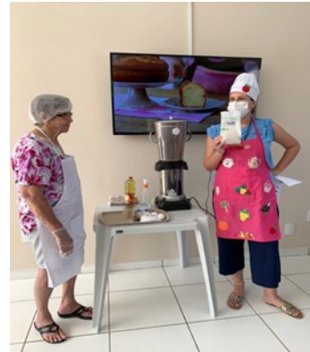
Foto 3- Aula Nutricional