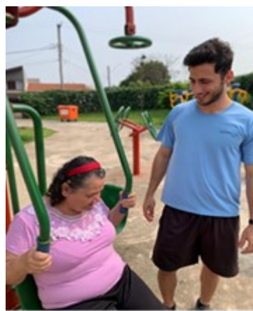
Foto-2 Academia ao ar livre