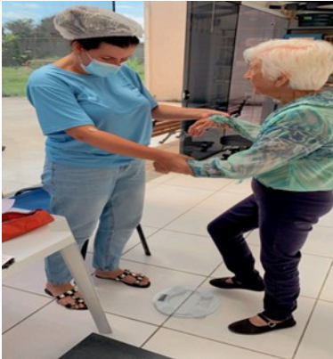
Foto 1- Avaliação Nutricional