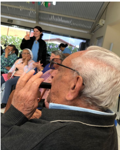
FOTO 1- Atividade com música