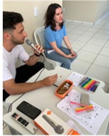
Foto-3 Bingo Confraternização Familiar