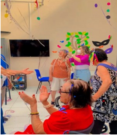
Foto 1- Atividade de Carnaval