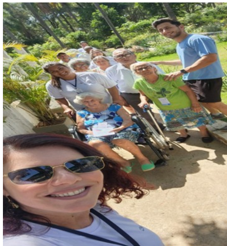
FOTO 2- Passeio no CESB