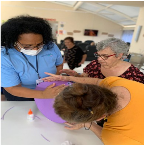
Foto 1- Confeção do Bolo Festivo