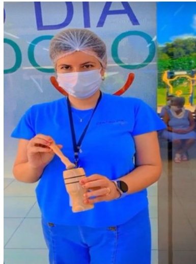
Foto 2- AULA NUTRICIONAL