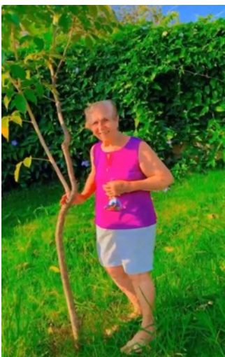
Foto 1- CAÇA AOS CHOCOLATES