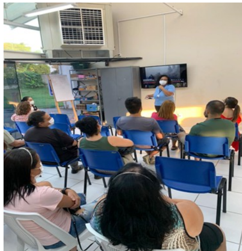
Foto 2- Reunião familiar