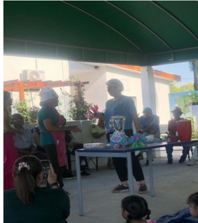
Foto 2- Culinária no CESB