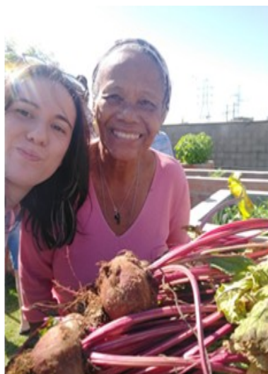
Foto 2- Colhendo Beterraba Para suco