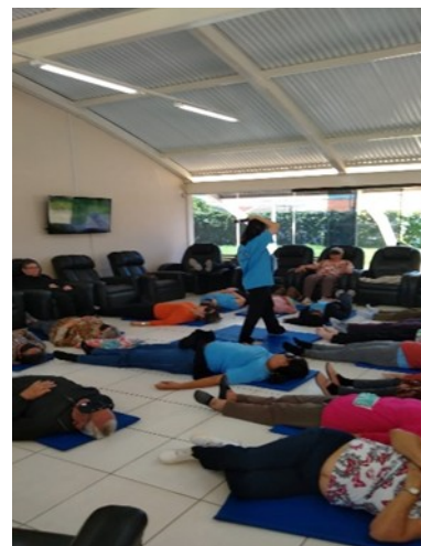
Foto 3- RELAXAMENTO