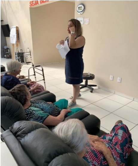
Foto 1- AÇÕES VOLTADA AO BEM ESTAR