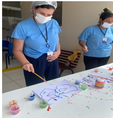
Foto 2- Atividade de Carnaval