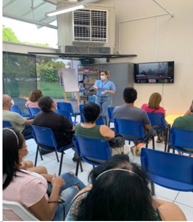
Foto 2- Reunião Familiar