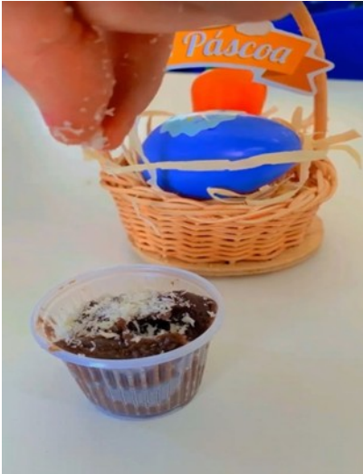
Foto 1- PASCOA NO CDI