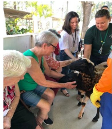
Foto 3- Passeio no CESB