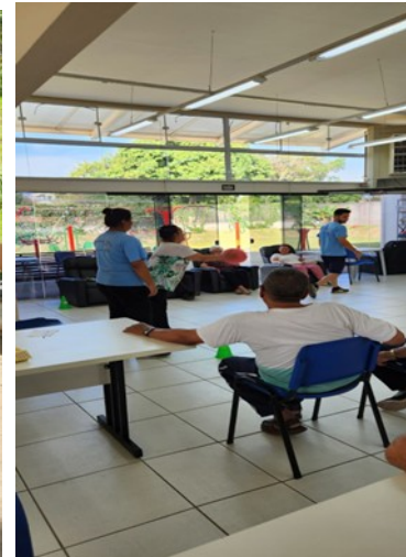
FOTO3- Circuito Jogos Adaptados