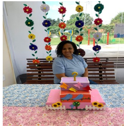
FOTO3- Aniversariante do Mês