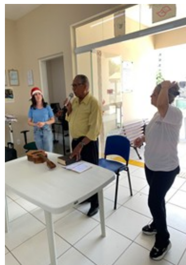
Foto 3- Confraternização Familiar