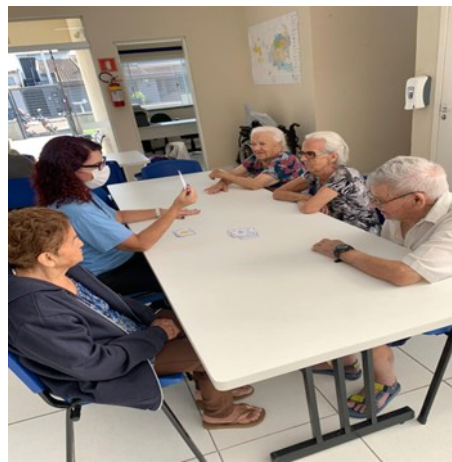
Foto 2- Foto 3- Atividade de estimulação Cognitiva