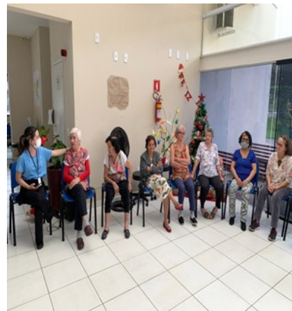
Foto 3- Roda de conversa