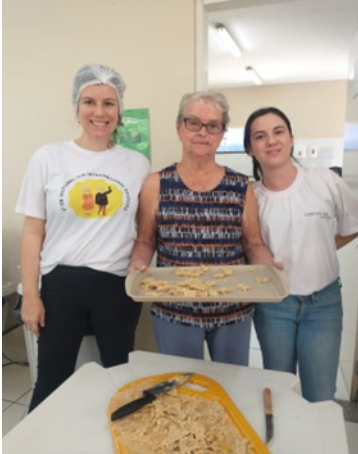
Foto 1- Atividade multidisciplinar resgate de memória afetivas e treino de função através de cozinhar