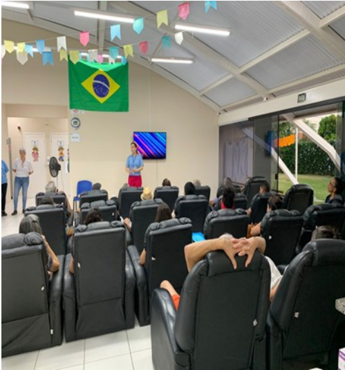
Foto 1- Reunião Familiar