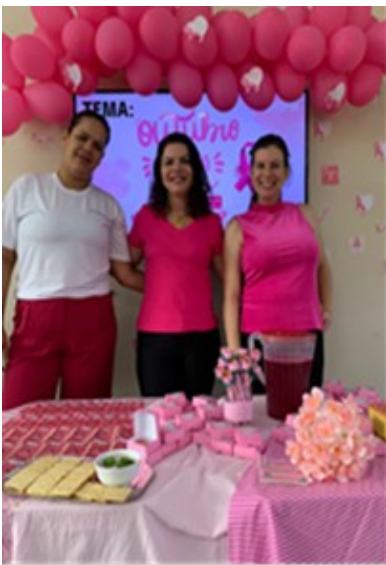
Foto 1- Palestra Outubro Rosa