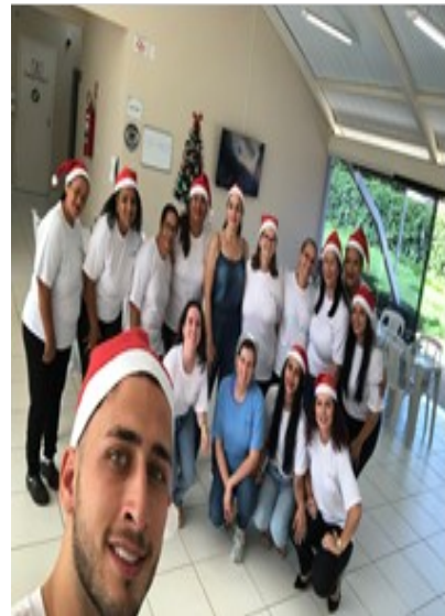
Foto-3 Equipe Confraternização Familiar