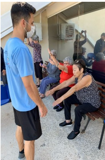
Foto 1- EXERCICIOS DE FORÇA