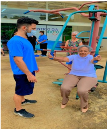
Foto 1 Academia