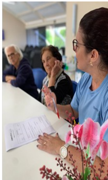
Foto 2- Atividade fortalecendo O cognitivo