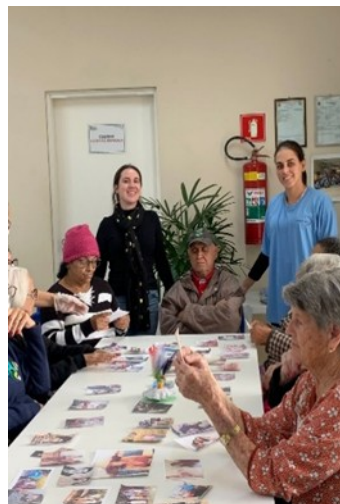
Foto 2- BAÚ DE MEMÓRIA