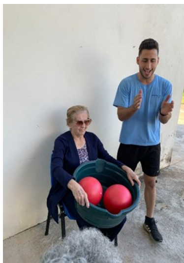
Foto 2 GINCANA