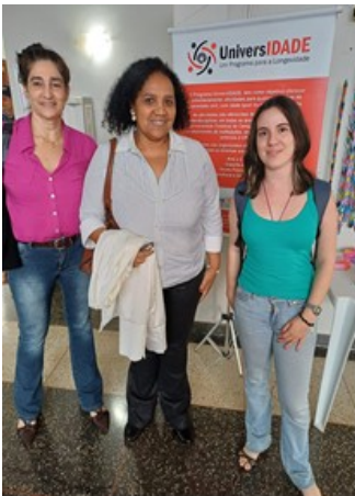
FOTO1- Programa p/ Longevidade Unicamp