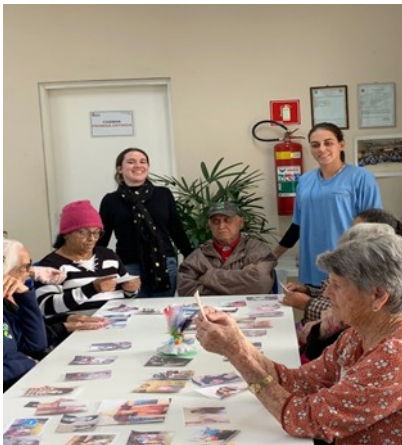
Foto 1- Terapia de reminiscência